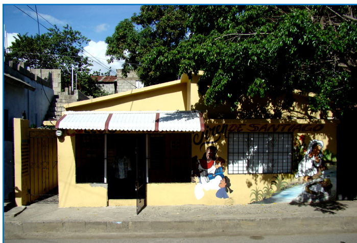
Das ist die Schule «Collegio Evangelico Jireh»

Seit längerem versucht die Schulleitung das direkt angrenzende Gebäude zu mieten. Das Haus verfügt über einen grossen Innenhof