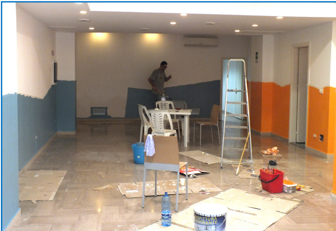
Es wird fleissig gemalt. Die weissen Wände erhalten Farbe.

Kinder für die Vertiefung der Geschichte nicht in verschiedene Altersgruppen aufteilen konnten. Durch die neuen räumlichen Möglichkeiten können wir endlich die Vertiefung altersgerecht gestalten. Neu bieten wir auch verschiedene Workshops an. Die Kinder und Jugendlichen können z.B. Basteln, Theaterspielen und Kochen.