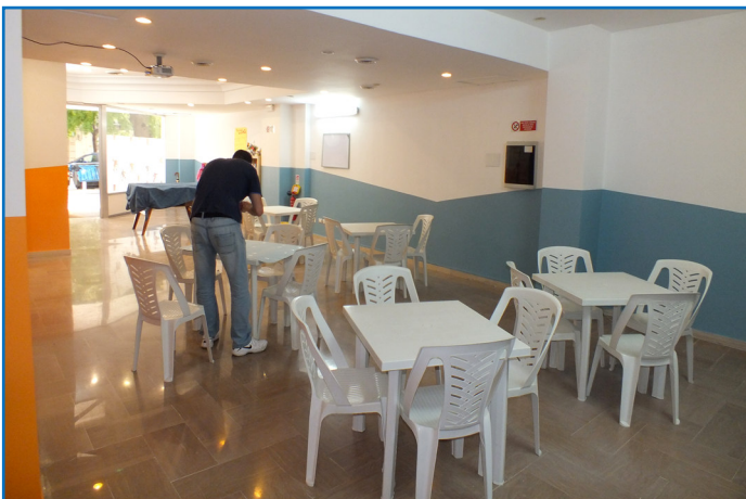
Hier sieht man die neuen räumlichen Dimensionen. Alles ist bereit. Es kann los gehen.