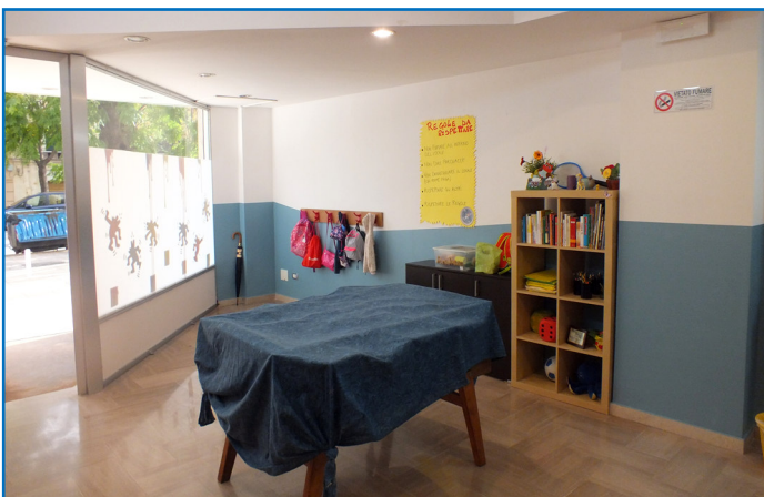
Der Eingangsbereich mit Kickerkasten.