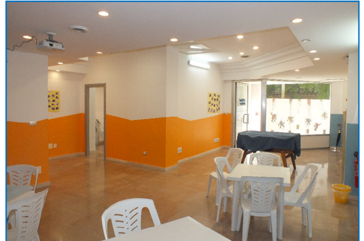
Die Türe links führt in den zweiten Raum (Bild unten).