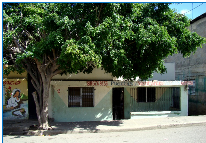
Und dies das angrenzende Gebäude zur rechten Seite