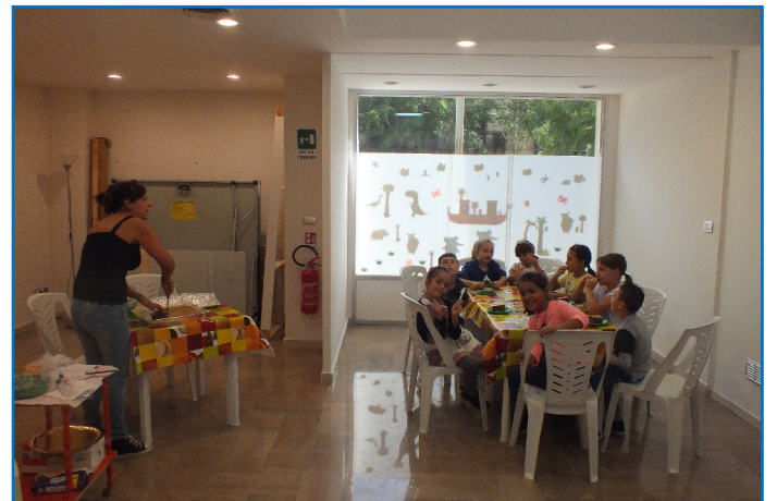
Durch diesen zweiten Raum kann auch mal in zwei Gruppen gearbeitet werden, ohne sich gegenseitig zu stören.