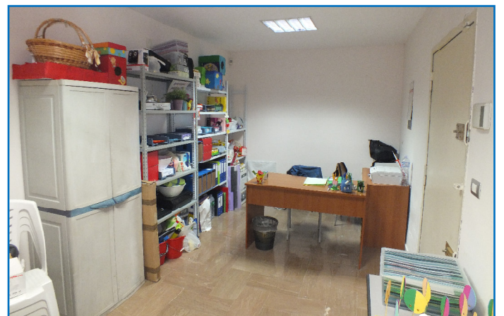
Auch ein kleines Büro hat nun Platz.